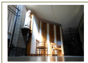
Dagkapel in parochiekerk Kelpen-Oler

In de parochiekerk in Kelpen-Oler is de afgelopen maanden door vrijwilligers hard gewerkt om de ruimte onder het oksaal aan te passen. Aan de ene kant is daardoor meer ruimte ontstaan bij uitvaarten. Aan de andere kant is een dagkapel ingericht. Binnenkort zal de dagkapel worden ingezegend.